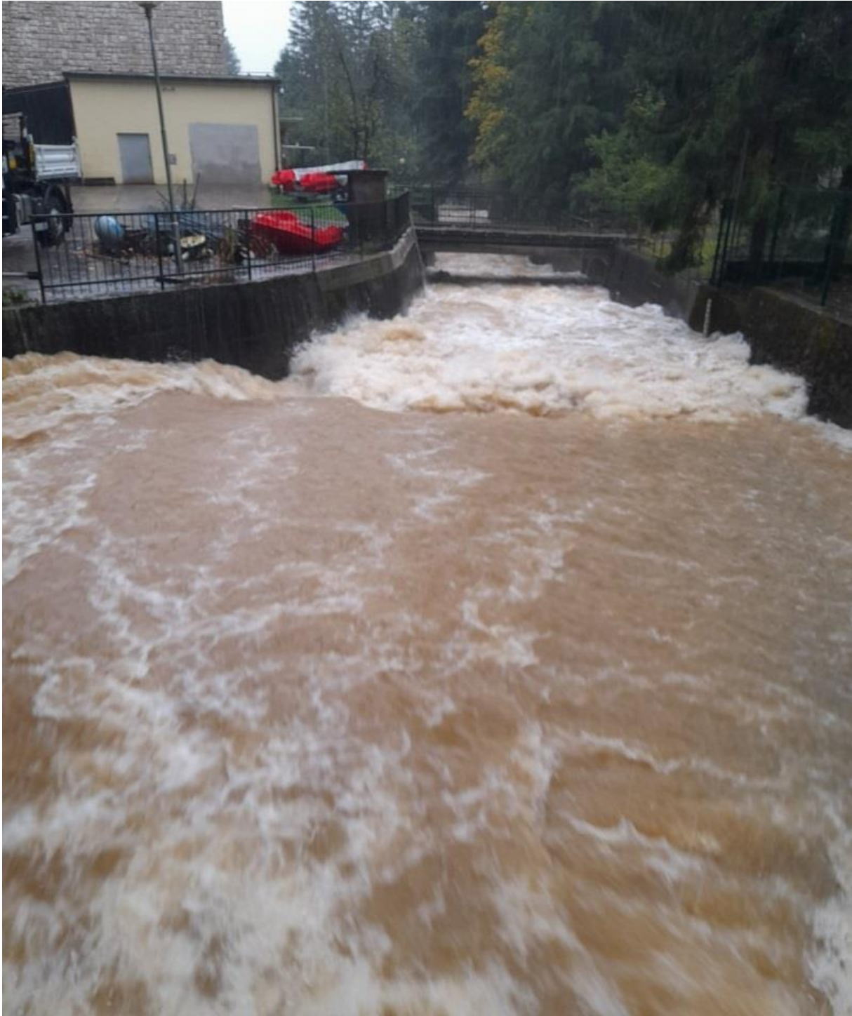
Slika 1. Izvor Vrelo, 15. listopad 2023.